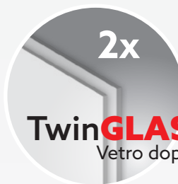
TwinGLASS Vetro doppio