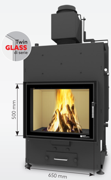
LOUIS AQUA 15 kW | fino a 200 m 2 Serbatoio: 45 kg o 30 kg