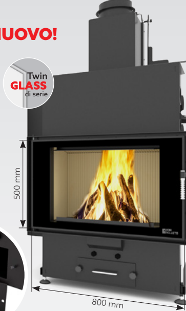
LOUIS PANORAMA AIR 10 kW | fino a 170 m 2 Serbatoio: 45 kg o 30 kg