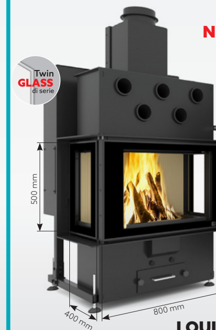
LOUIS GRAND AIR 10 kW | fino a 170 m 2 Serbatoio: 30 kg o 45 kg