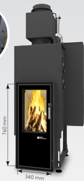
FELIX LONG AIR 10 kW | fino a 150 m 2 Serbatoio: 30 kg