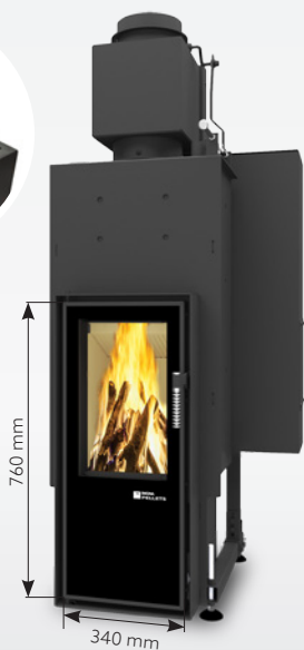
FELIX LONG AQUA 13 kW | fino a 170 m 2 Serbatoio: 30 kg