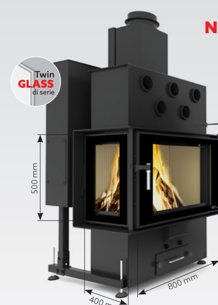
LOUIS CORNER LEFT AIR 10 kW | fino a 170 m 2 Serbatoio: 30 kg o 45 kg