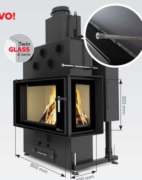
LOUIS CORNER RIGHT AIR 10 kW | fino a 170 m 2 Serbatoio: 30 kg o 45 kg