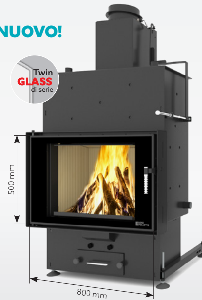
LOUIS PANORAMA AQUA 15 kW | fino a 200 m 2 Serbatoio: 45 kg o 30 kg