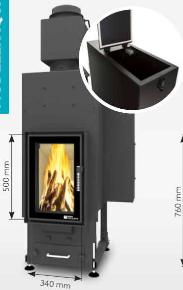
FELIX AQUA 13 kW | fino a 170 m 2 Serbatoio: 30 kg