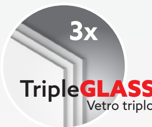
TripleGLASS Vetro triplo