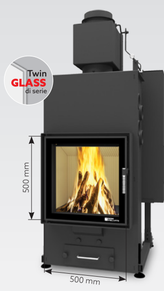
ALEX AIR 10 kW | fino a 170 m 2 Serbatoio: 30 kg