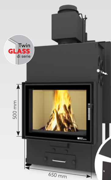
LOUIS AIR 10 kW | fino a 170 m 2 Serbatoio: 45 kg o 30 kg