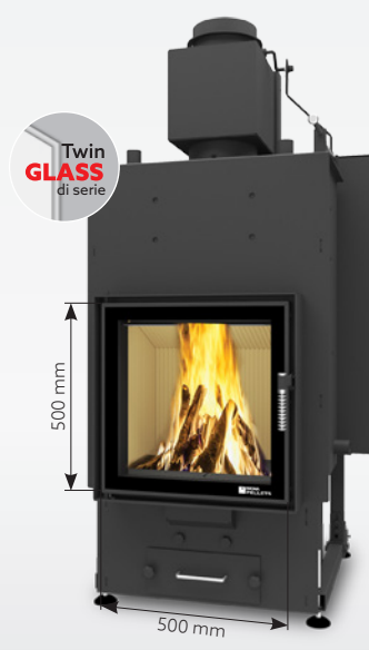
ALEX AQUA 15 kW | fino a 200 m 2 Serbatoio: 30 kg